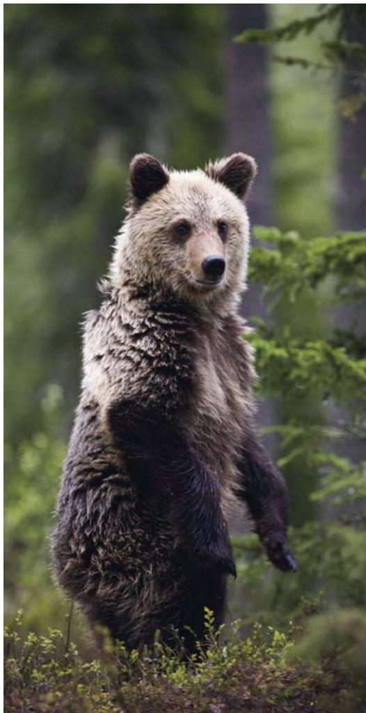
En björn som står på två ben gör det för att få överblick. I det läget attackerar den aldrig.

Björnens normala reaktion på en människa som närmar sig är att ta skydd. Det gör den mycket skickligt. De flesta björnmöten märks aldrig. Att över huvud taget få syn på en björn i naturen är alltså en sällsynhet.